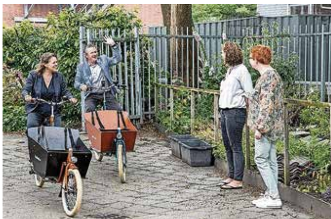
Wethouders brengen Preventieakkoord rond per bakfiets.

In totaal zijn er 24 acties in het Gouds Preventieakkoord opgenomen om Gouda gezonder te maken. In 2022 worden deze acties geëvalueerd en is er ook ruimte voor nieuwe initiatieven. Heb jij een idee hoe je Gouda gezonder kan maken? Neem contact op met Aafke van Leeuwen, via preventieakkoord@sportpuntgouda.nl